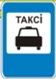
Знак "Место стоянки такси"