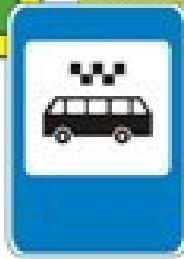
Знак "Остановочный пункт экспресс-маршрута"