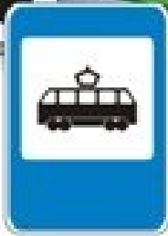
Знак "Остановочный пункт трамвая"